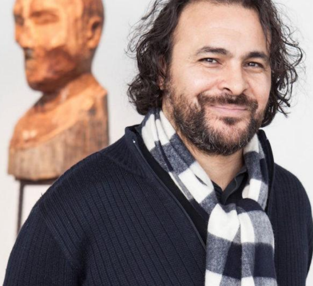
Kader Attia (Dugny, 1970).