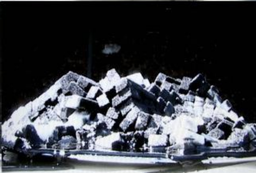
Oil and Sugar, 2007.