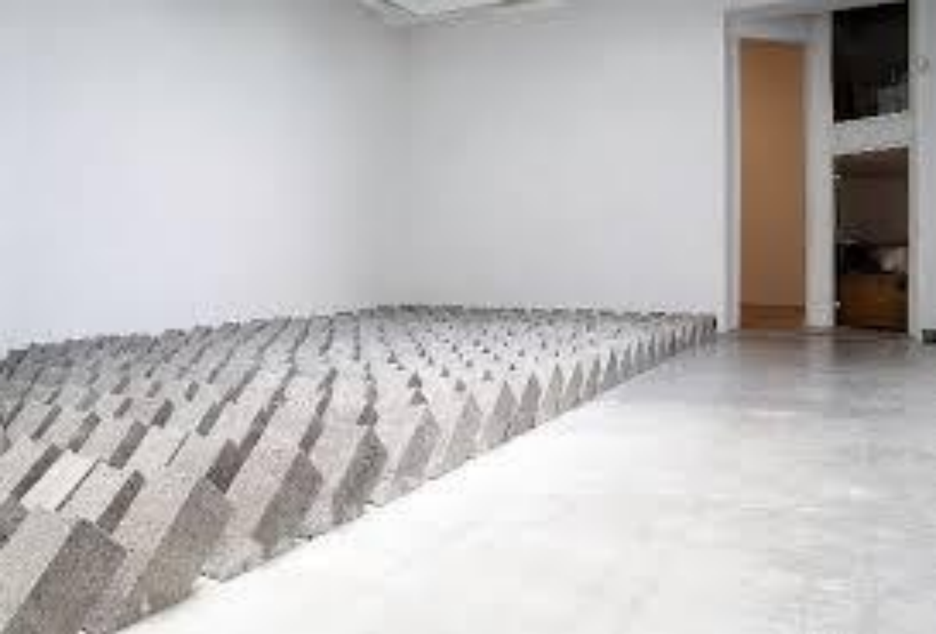
Sans titre, 2008.