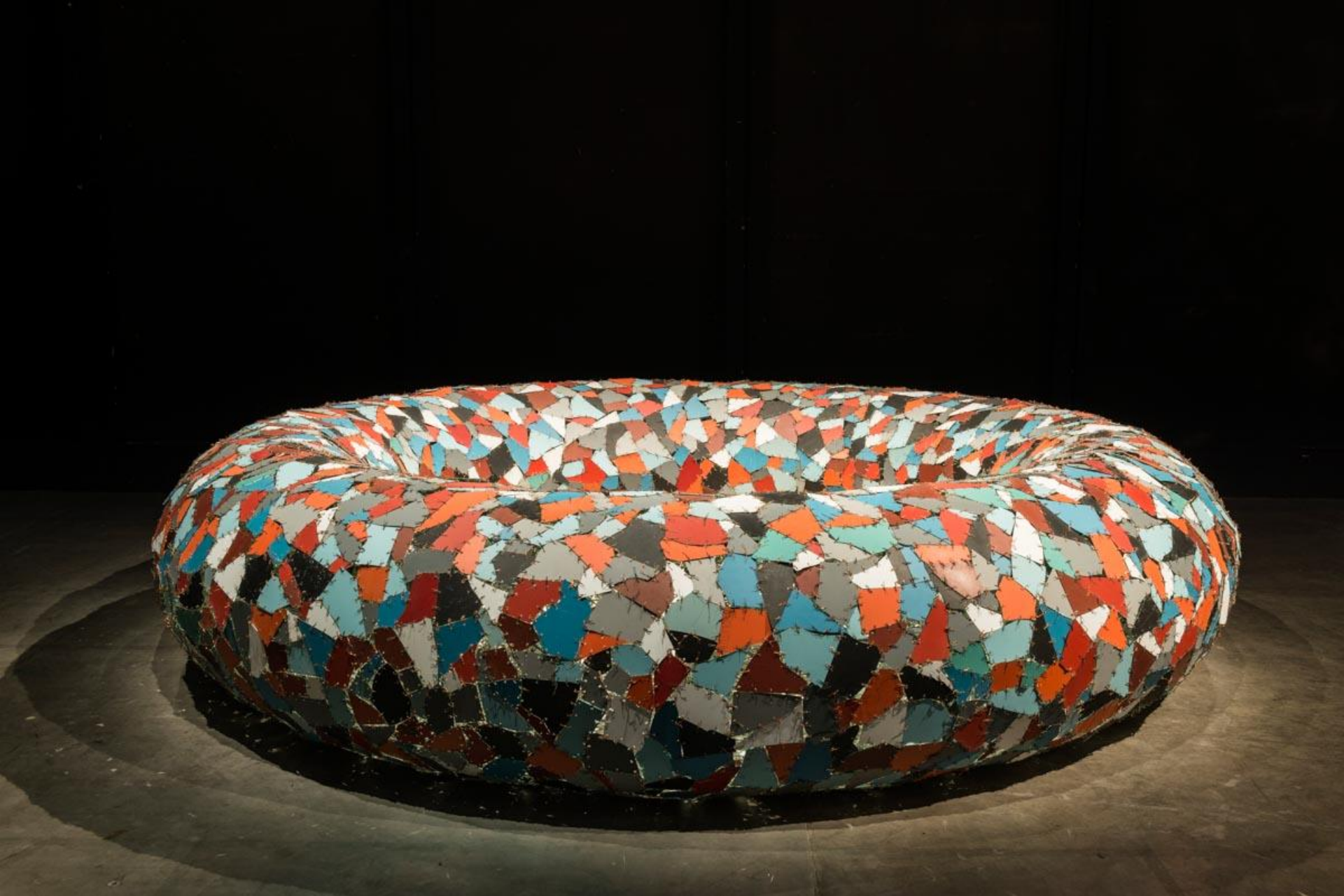
Ring Theory, 2015.