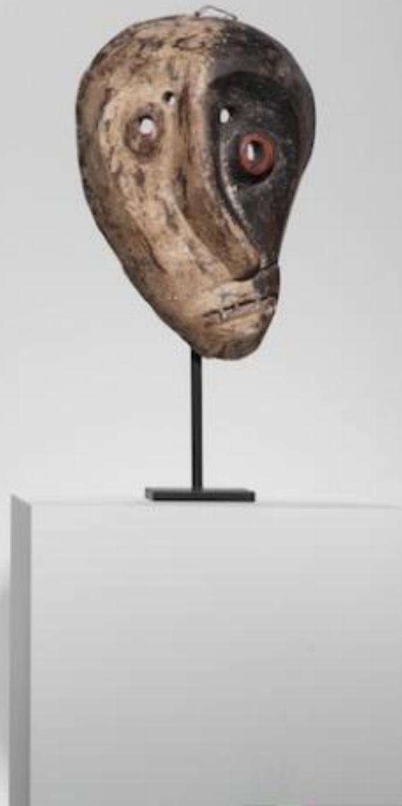
Gueule cassée, 2013.