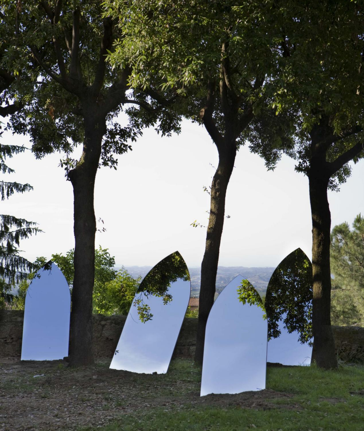
Holy Land, 2006.