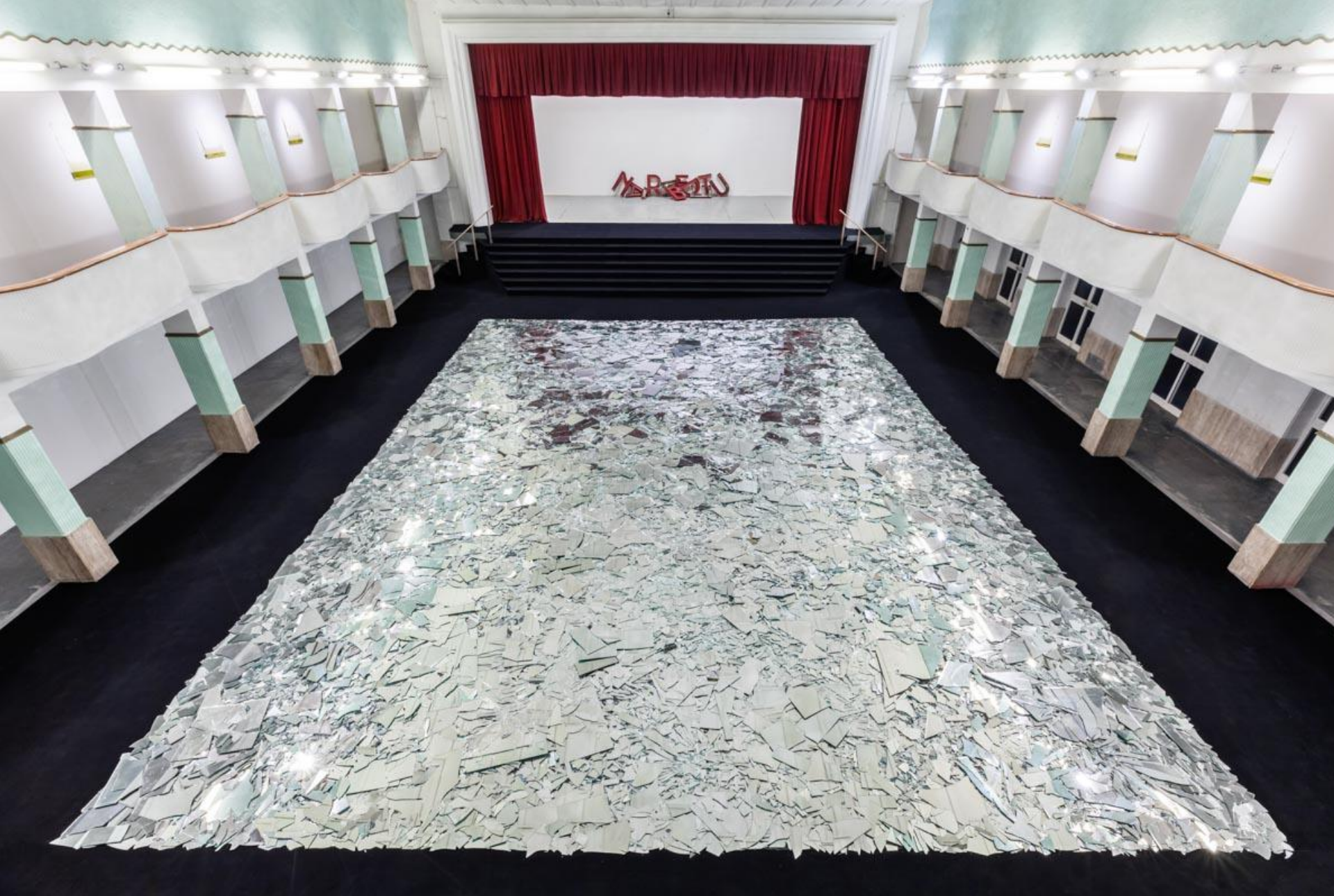
Le grand miroir du monde, 2017.