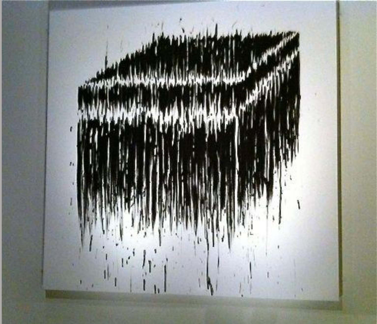
Black cube 4, 2005.