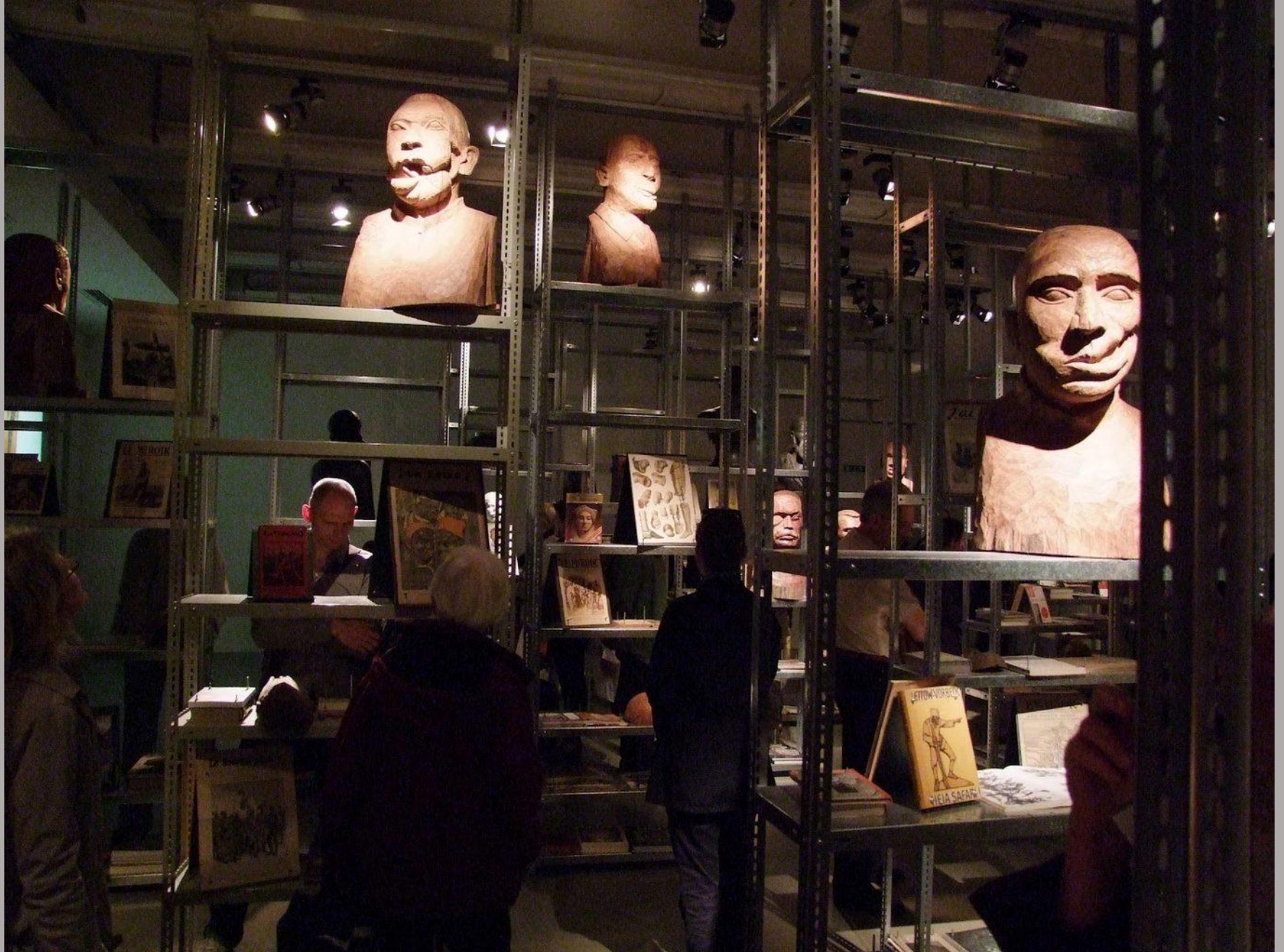
The Repair from Occident to Extra-Occidental Cultures, 2012