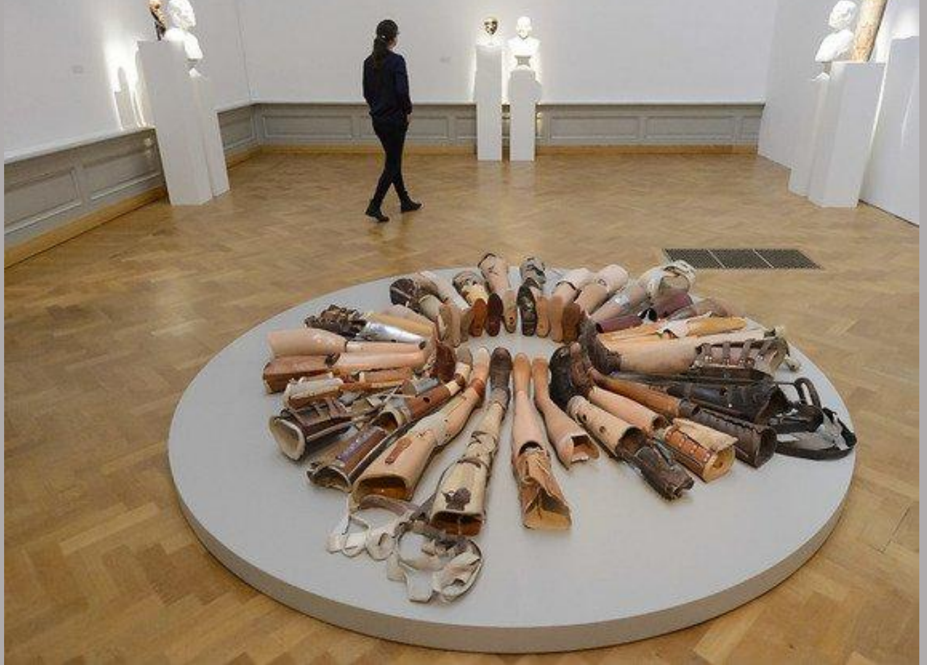
Artificial Nature , 2014.