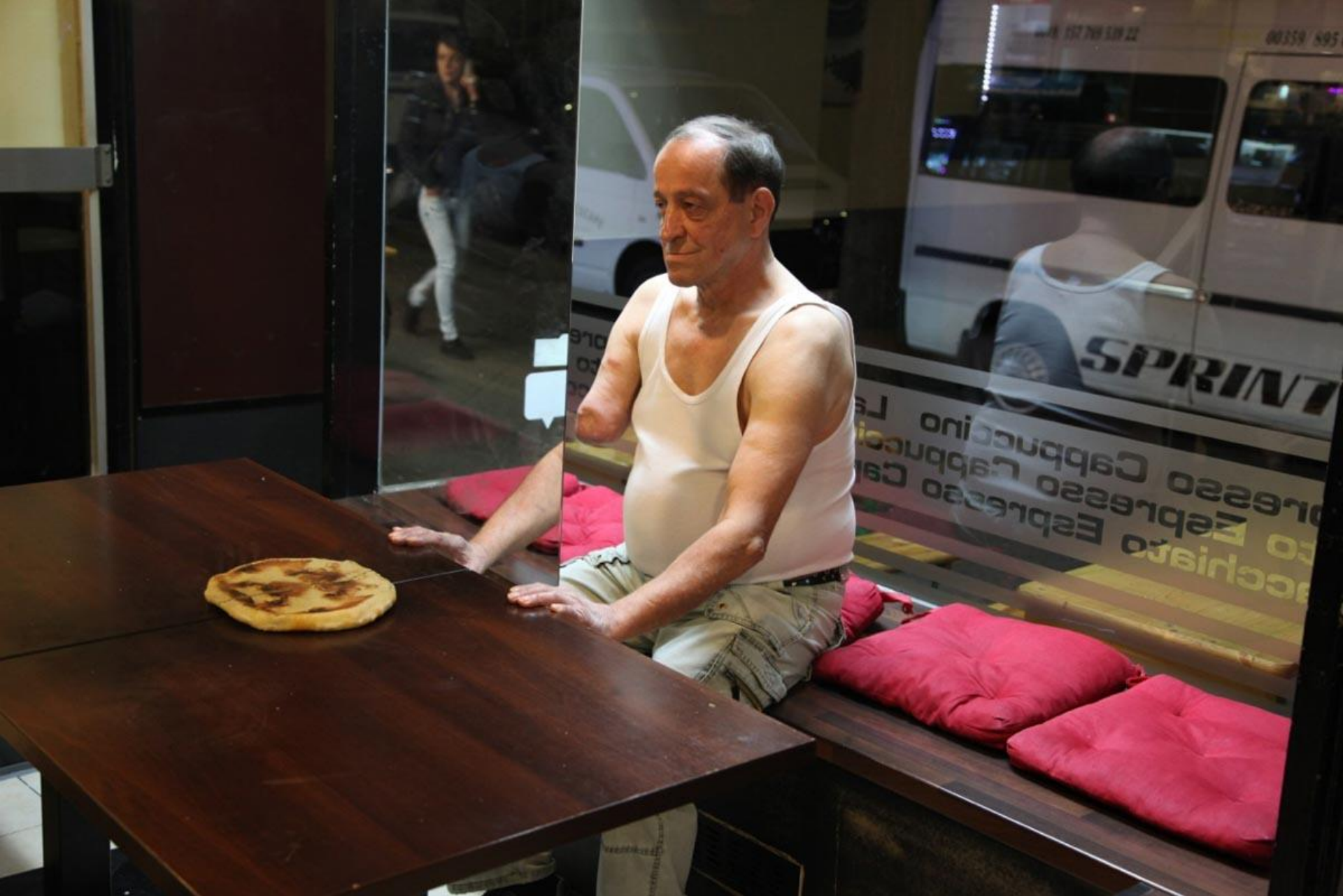
Réfléchir la mémoire, 2016.