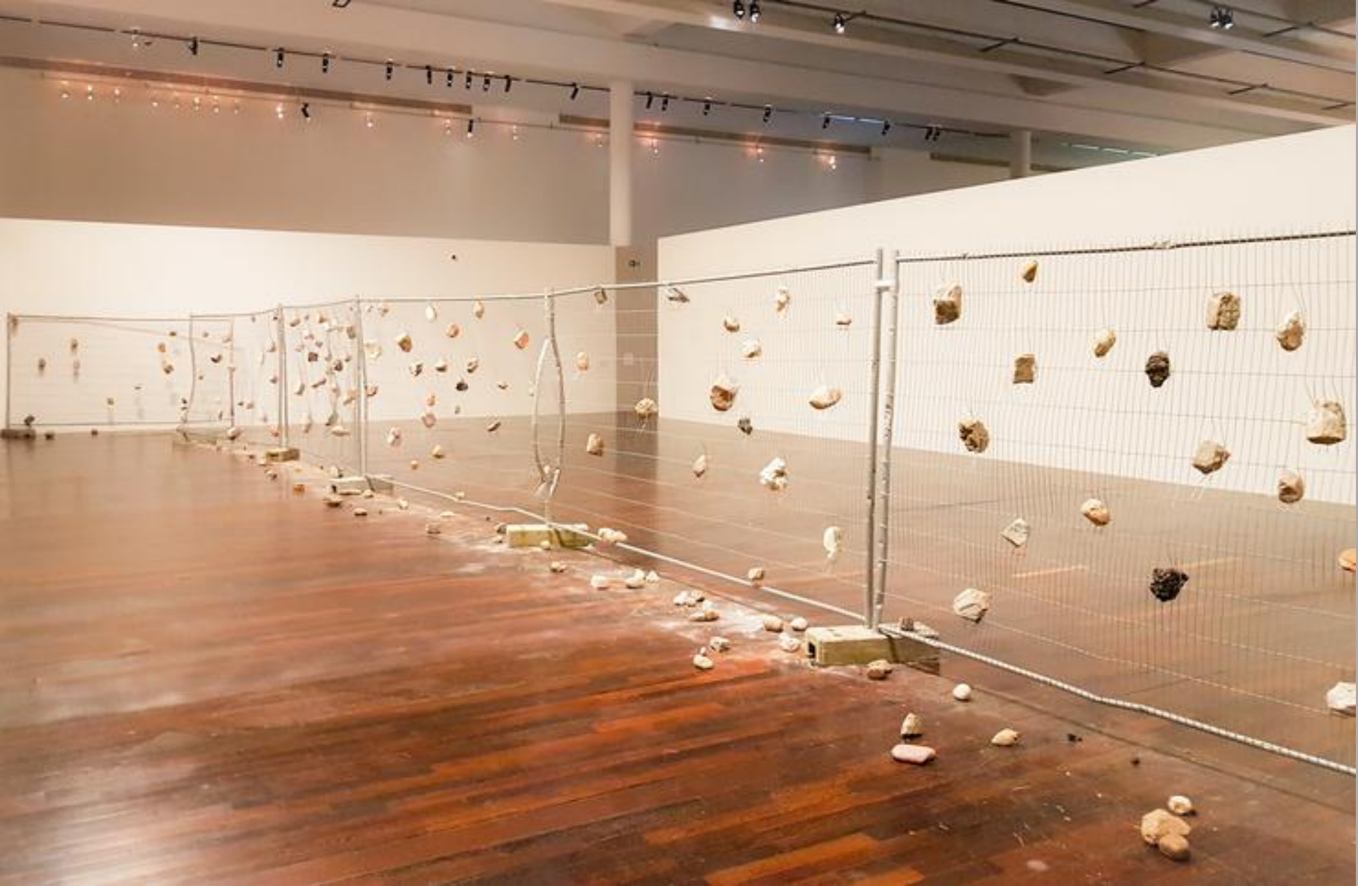
On n'emprisonne pas les idées, 2018.