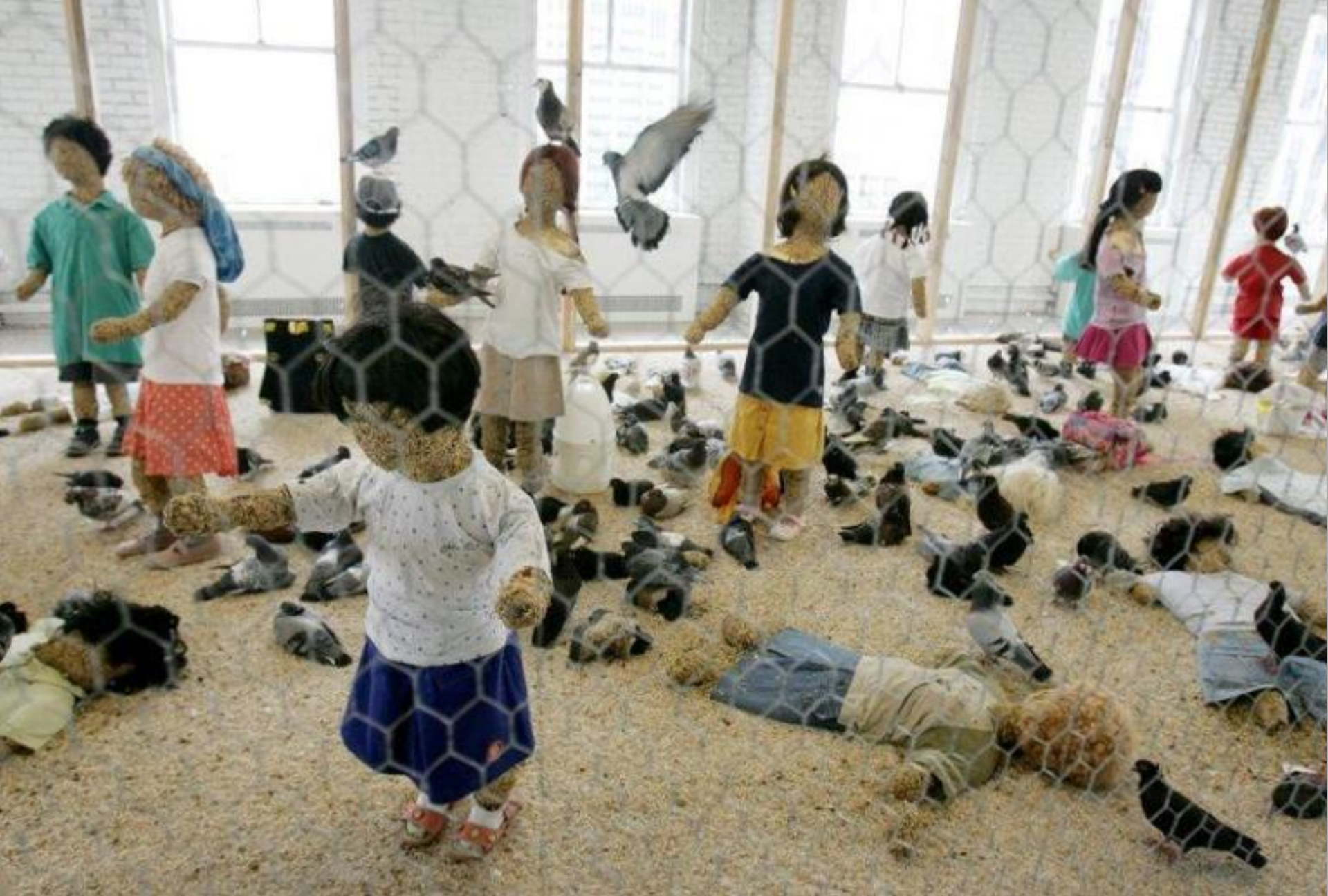
Flying rats, 2005.